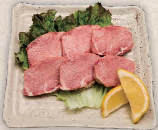
特上タン (写真はイメージです)