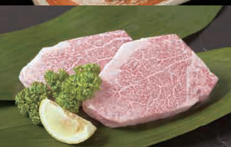
米沢牛ヒレ※画像は2人前となります。