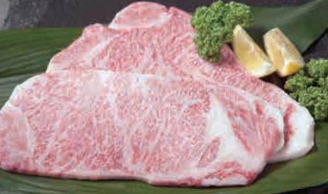
特上ロース※画像は3人前となります。